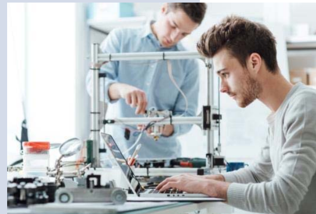
Robotisering & digitalisering