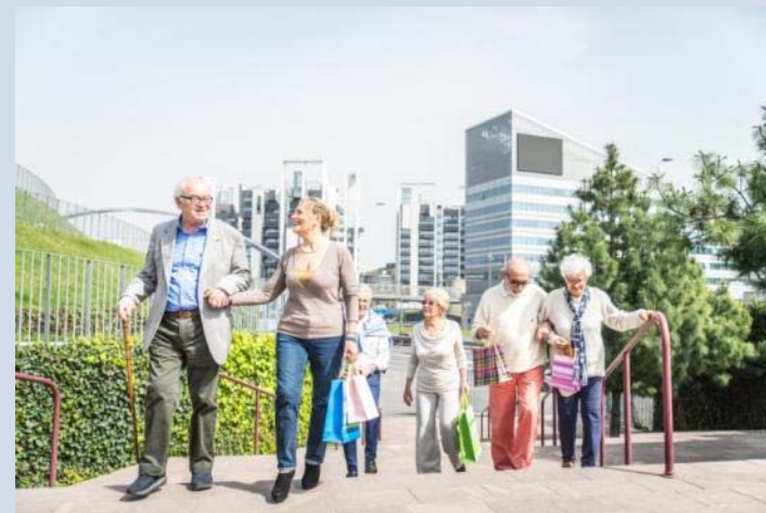
Vergrijzing & verstedelijking